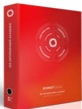
Das neue Handbuch zum Seminar FührungsEnergie, mit > 14 neuen Tools und praxiserprobten Strategien

Im neuen Lehrwerk und dem FührungsBooster stecken nicht nur 40 Jahre Erfahrung, sondern auch jede Menge praxisnahe Umsetzungshilfen.