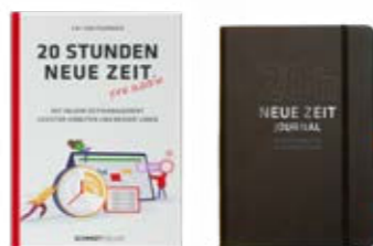
Buch und Journal »20h neue Zeit«